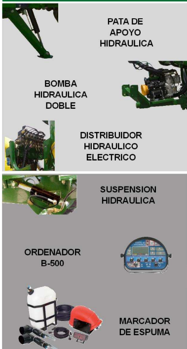
PATA DE APOYO HIDRAULICA