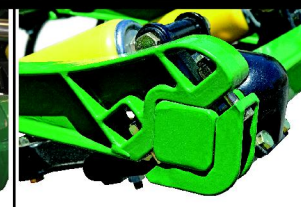
AMARRE DE SEGURIDAD CON DOBLE RESORTE