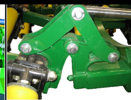
TRAVESAÑOS EN FUNDICION DE ACERO DESMONTABLES