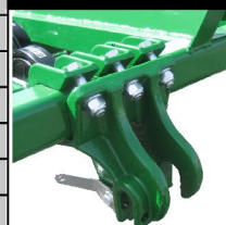
ENGANCHE CATEGORIA II Y III

NOTA: LOS DATOS DE ESTE CATALOGO SON ORIENTATIVOS FITO, S.A. SE RESERVA EL DERECHO DE MODIFICARLOS SIN PREVIO AVISO