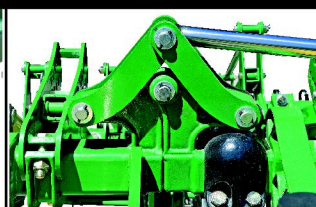
BISAGRAS EN FUNDICION DE ACERO Y PITONES DE ENCAJE