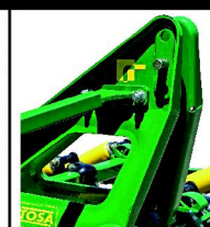
TORRETA EMBUTIDA EN CHAPA DE ACERO