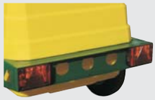
CONJUNTO DE LUCES